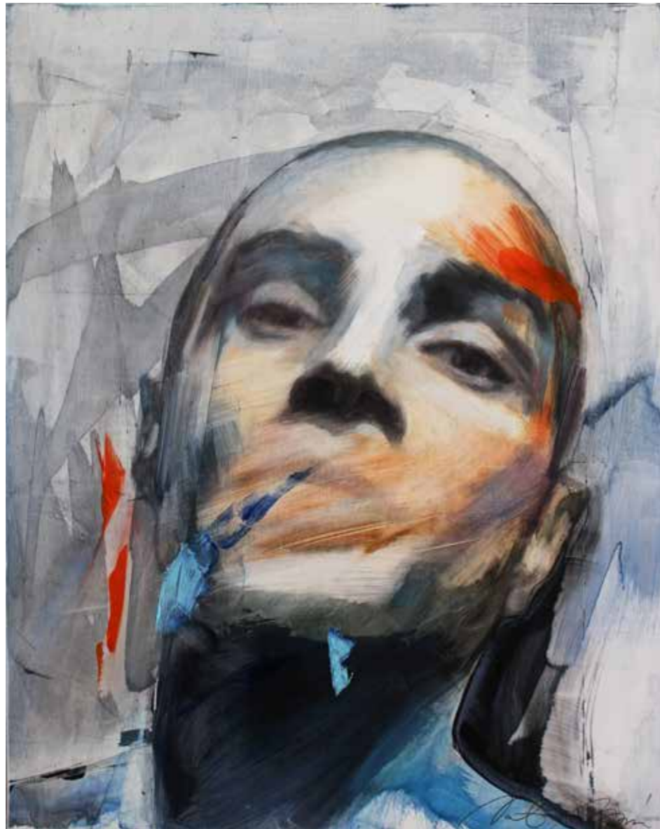
◀ ADAM ulje na panelu 40x30x3 cm olio sul pannello 40x30x3 cm