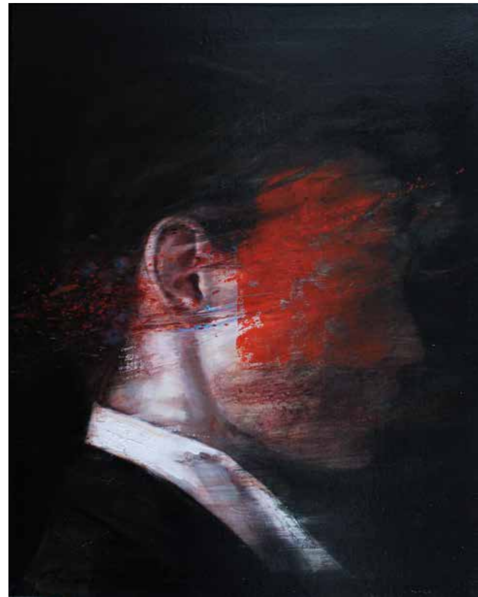
▶ THE SILENCE OF THE WHISPER 2020, ulje na platnu 50x40 cm 2020, olio su tela 50x40 cm