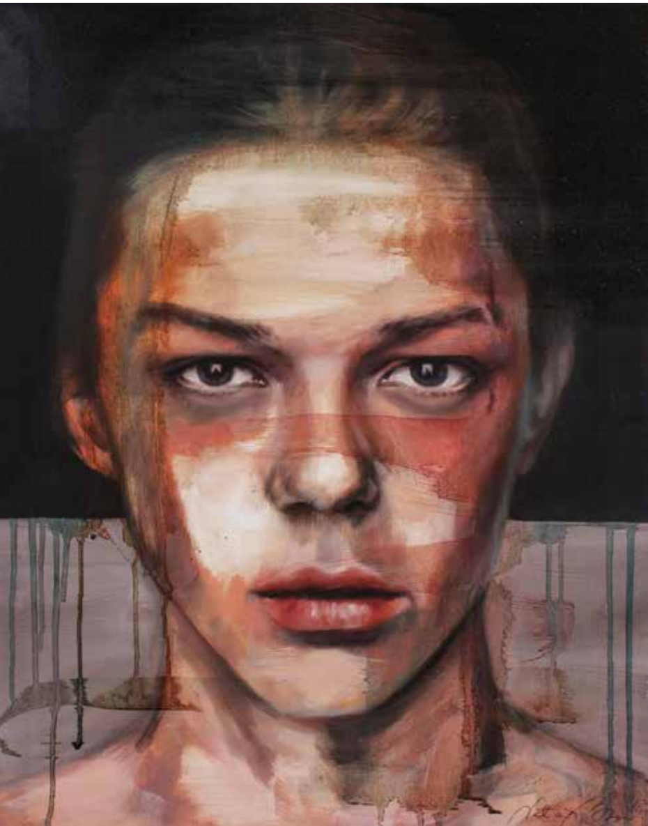
◀ MIKKA 2018, ulje na platnu 50x40x1 cm 2018, olio su tela 50x40x1 cm